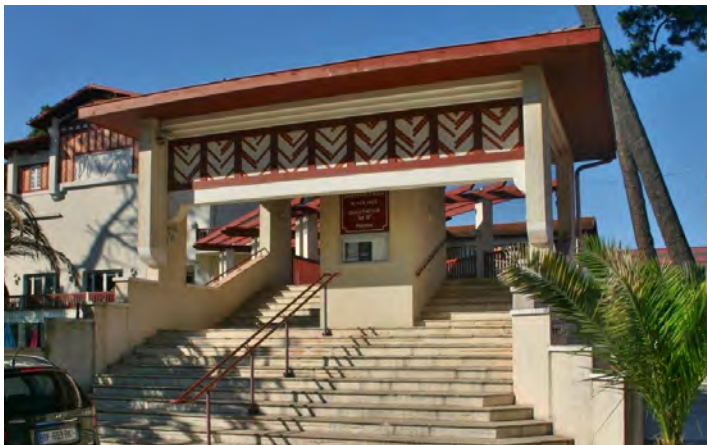
▲ Porche d'entrée