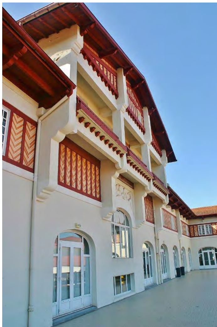
▲ Balcon Nord-Ouest longeant les salons de réception