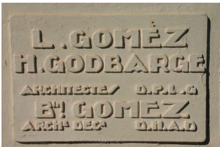
▲ Sculpture en bas relief des noms des architectes