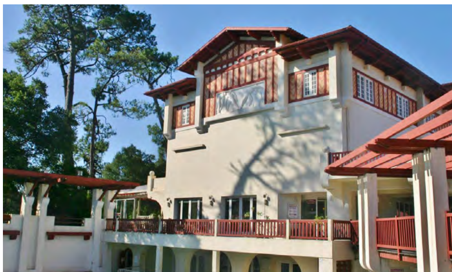
▲ Façade principale Nord-Est

1 ère phase : 1927-1928 (partie gauche jusqu'au fronton central inclus) 2 e phase : 1930-1931 (partie droite et aile en retour)