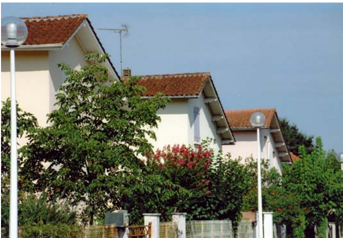
▲ Caractéristiques architecturales : même organisation et même orientation