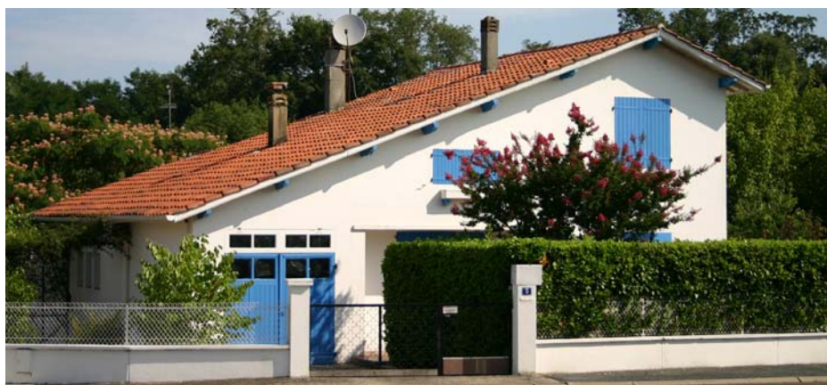
▲ Un castor traditionnel à Mont de Marsan

MAISON // CONSTRUCTION NEUVE // RÉGIONALISTE // HOMOGÉNÉITÉ URBAINE // LOTISSEMENT