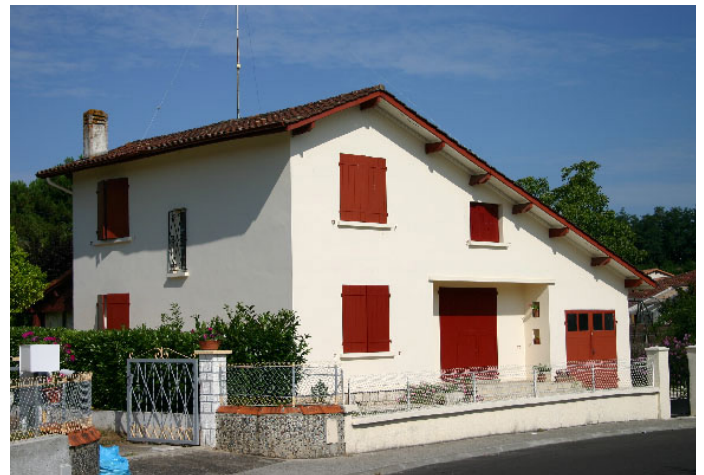
▲ Implantation au centre de la parcelle, façade pignon sur rue