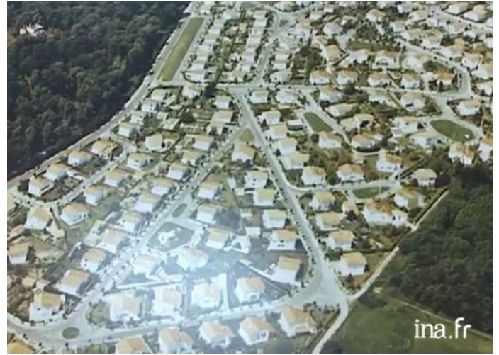
▲ Vue aérienne de cette nouvelle forme d'urbanisation