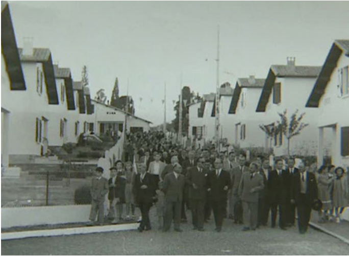
▲ Inauguration du tout premier quartier à St Pierre du Mont

http://fresques.ina.fr/landes/fiche-media/Landes00418/les-castors-landais.html