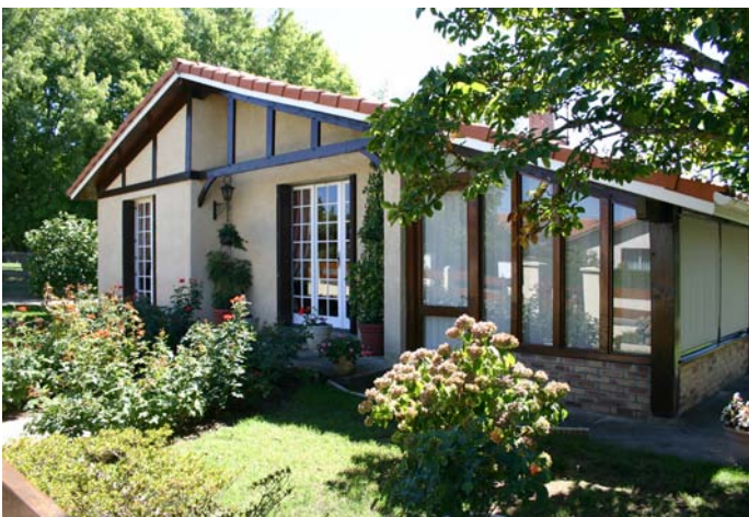
▲ Exemple d'évolution de l'habitat